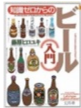
知識ゼロからのビール入門 (幻冬舎)