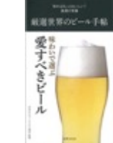
厳選世界のビール手帖 (世界文化社)