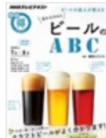
NHKテレビテキスト ビールのABC (NHK出版)