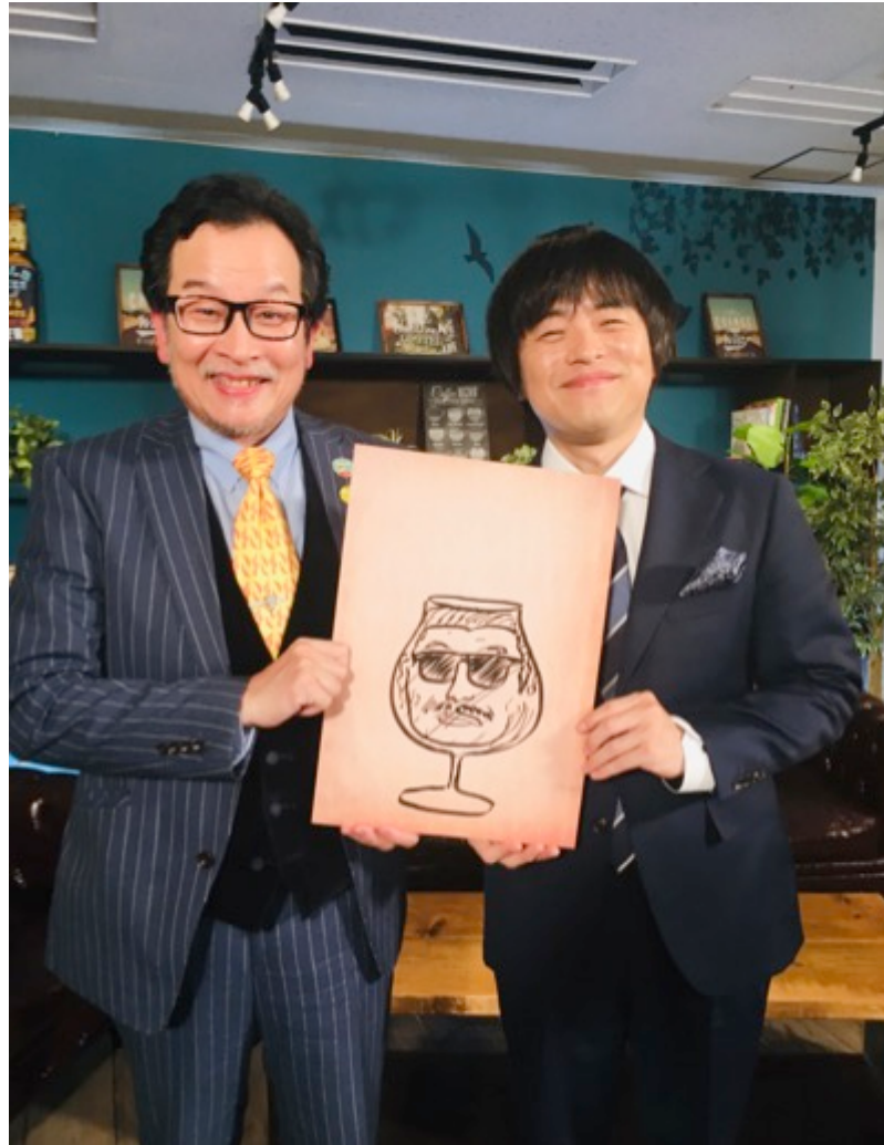
「バカリズムの大人のたしなみズム」より