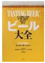
ビール大全 (楽工社) ランディ・モーシャール (著) 藤原ヒロユキ (監修)