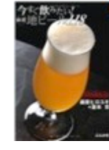
今すぐ飲みたい厳選地ビール118