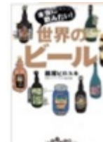
本当に飲みたい! 世界のビール (たいわ文庫)