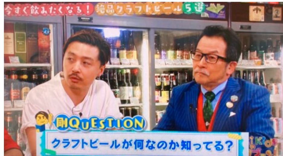
「キンキキッズのブンブブーン」より