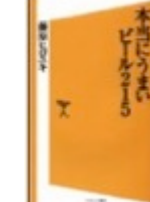
本当にうまいビール215 (ソフトバンク新書)