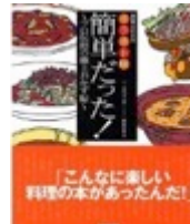
簡単だっ! プロ伝授の極上おかず帖 (NHK食彩浪漫)