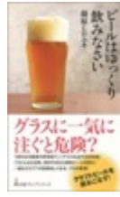
ビールはゆっくり飲みなさい (日経プレミアシリーズ)