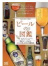
ビールの図鑑 (マイナビ)