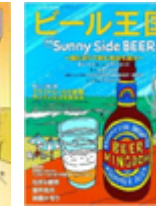
ビール王国 [季刊誌] 編集顧問: 藤原ヒロユキ (ワイン王国)