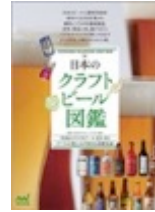
日本のクラフトビール図鑑 (マイナビ)