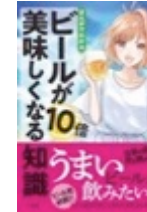
ビールが10倍美味しくなる知識 (小学館) 藤原ヒロユキ (原案) いっさ (著)