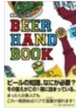
藤原ヒロユキのBEER HAND BOOK (ステレオサウンド)