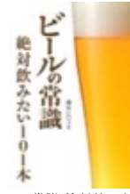
ビールの常識 絶対飲みたい101本 (Beer ASCII)